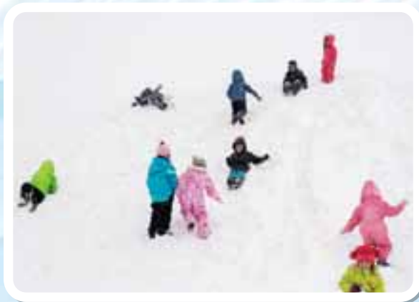
雪のシャワーだ! ヒヤッホー!!