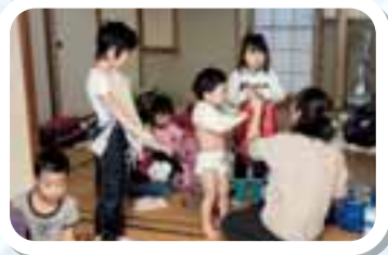
ヒュッテに戻って着がえ着がえ