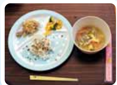
今日のメニューは ふりかけごはん 具たくさんスープ