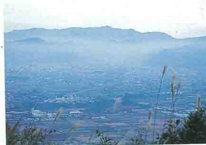
▲富神山山頂からの展望 左手中頃に見える森が霞城公園(山形城跡) ▲富神山山頂