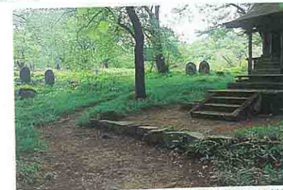
柏木山古戦場(愛染神社)

古戦場はこの神社の南方で、天正12年(1584)、山形城主最上義光と仲の悪かった上山城主が伊達軍の手引きをして山形城を攻めようとしたが、最上軍の鉄砲隊に敗れ、上山に退散したと言う記録が残っています。(上山軍と最上軍の戦が何度となく行われたと考えられます。)