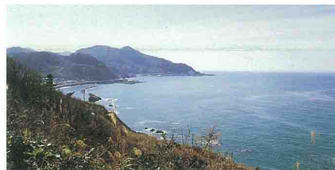
笠取峠から日本海を望む