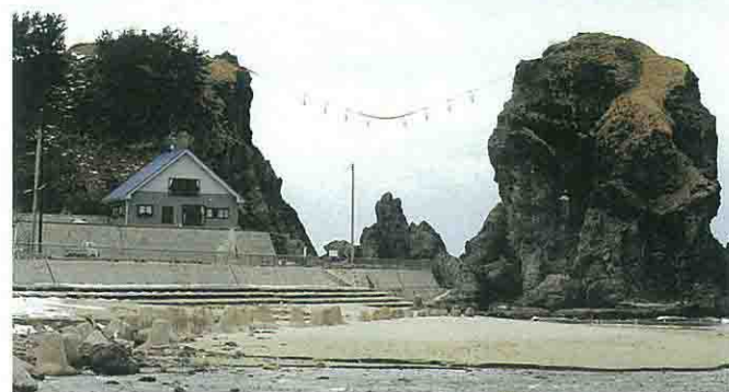
琴平岩・立岩としめ縄

環境庁から日本で最も美しい海水浴場の一つ、とお墨付きをもらったこともある三瀬海岸。この南側に琴平岩と立岩があります。その二つの岩にはしめ縄がわたり、夕日とのコントラストは絶景です。