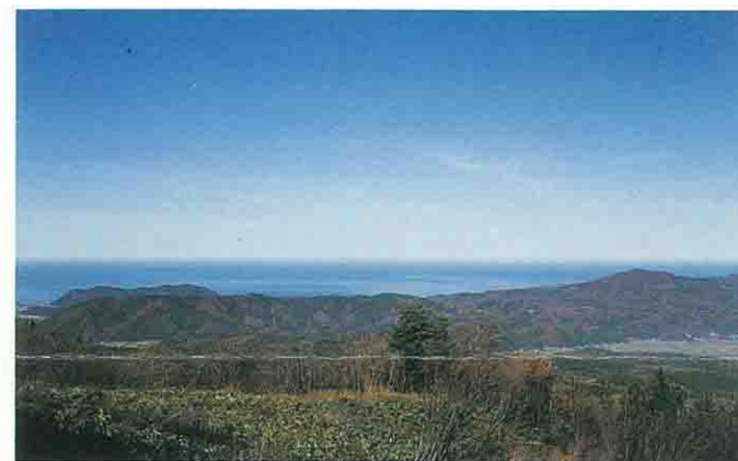
熊野長峰から日本海を望む