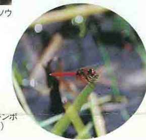
ハッチョウトンボ (6月~8月)