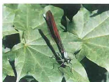
ヒガシカワトンボ(6月~7月)

総面積2.5haの湿原群の中には、高山性植物のマンネンシギや多くの低標高湿地性植物が混生している。また昆虫類では、日本で最も小さいと言われているハッチョウトンボをはじめ、ギフチョウ、エゾミドリシジミ等のチョウ類も生息し、寒地系、