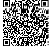
(PC・スマートフォン用)

PM2.5（微小粒子状物質）に関する情報（山形県 水大気環境課） ( http://www.pref.yamagata.jp/ou/kankyoenergy/050014/pm25.html )