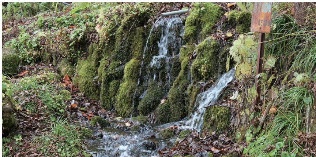
〔管理者〕 戸沢地域市民センター 〔保全団体〕 樽石いきものふれあいの里の会