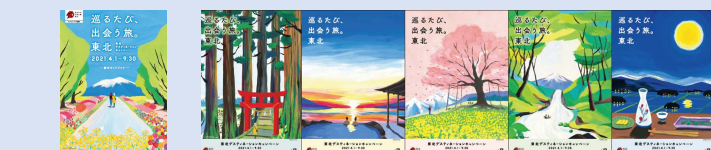
ガイドブック(春版)