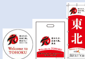
啓発ツールの一例