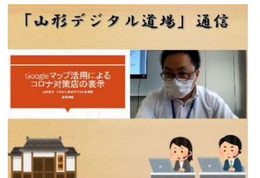
山形デジタル道場