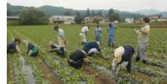
農福連携事例(大根の間引き作業)