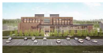
東北農林専門職大学(仮称)(イメージ)