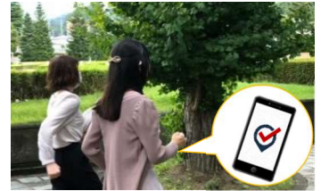
デジタルを活用したウォーキング事業(イメージ)