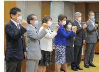
新型コロナワクチン接種事業の実施に関する合同発表