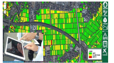
衛星リモートセンシングによる生育診断