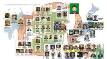
ビジネス関係人口の創出(イメージ)