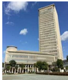
創業支援センターを設置する霞城セントラル