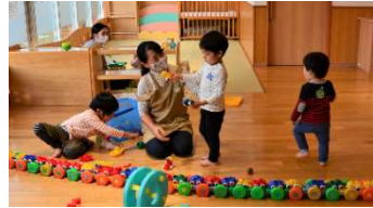
子育て支援施設での保育の様子