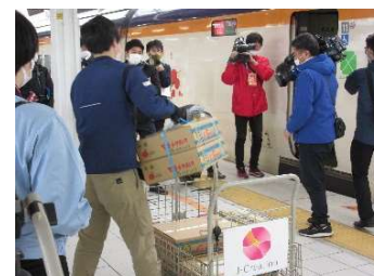
山形新幹線によるラ・フランスの荷物輸送