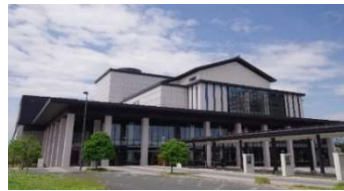
県総合文化芸術館