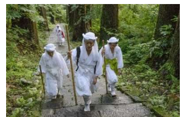
出羽三山での山伏修行体験