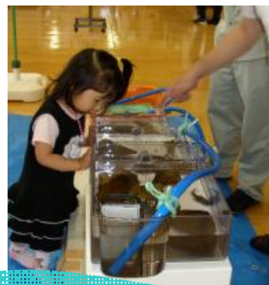
水生昆虫を観察してみよう