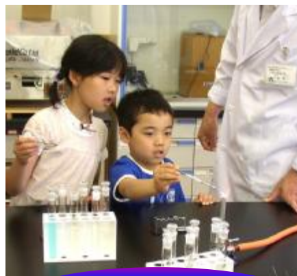
花火の色を作ろう