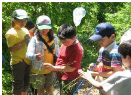
里山を観察してみよう