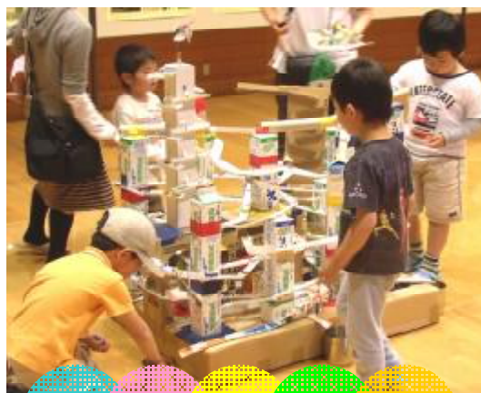
ジャンボビー玉コースター