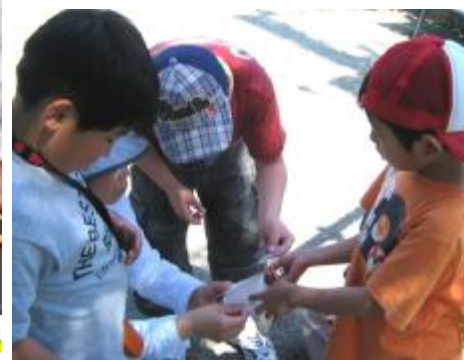
身近な水辺の健康診断 をしてみよう