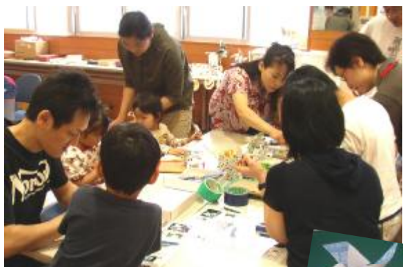
ウィンドカーを作ろう