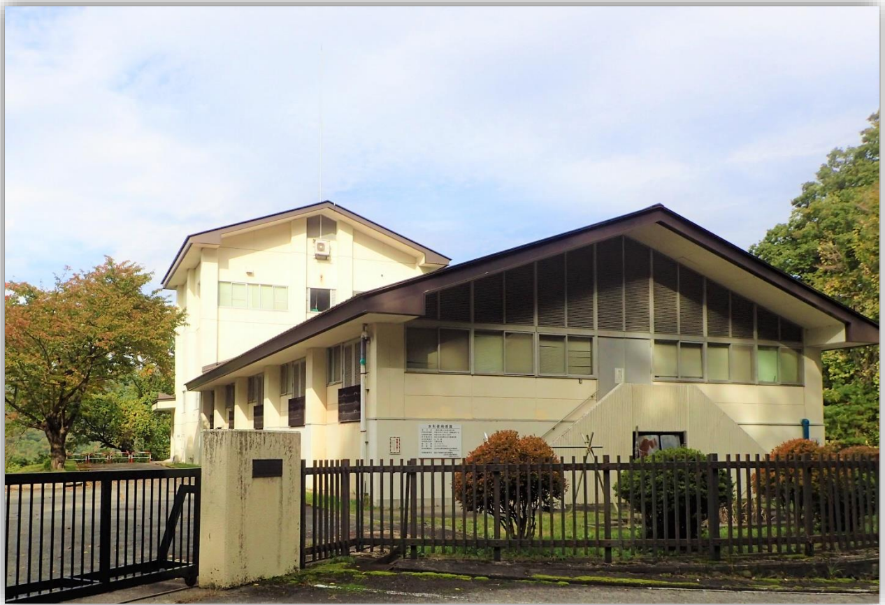
八幡原工業用水道浄水場