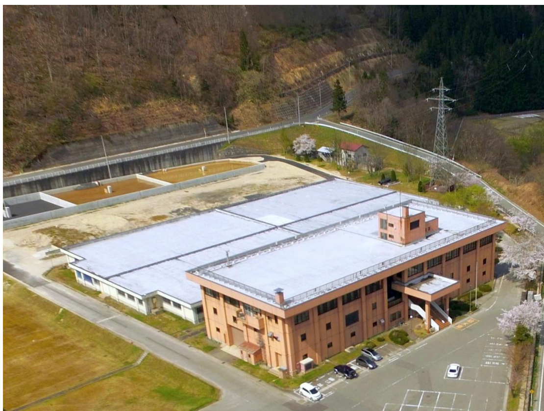
村山広域水道 西川浄水場