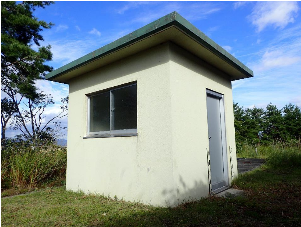
置賜広域水道 川西量水所