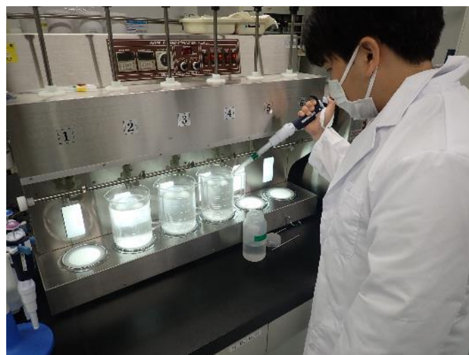
ジャーテスト（凝集試験）