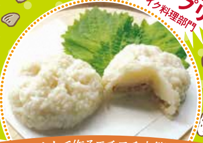
そうめんで作るモチモチ小籠包 残ったそうめんでもモチモチ!! ジューシー小籠包!!