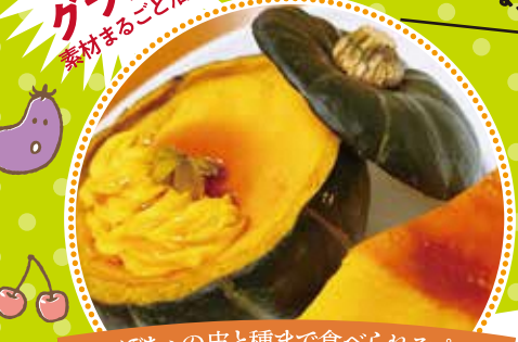
かぼちゃの皮と種まで食べられるプリン まるごと南瓜プリン