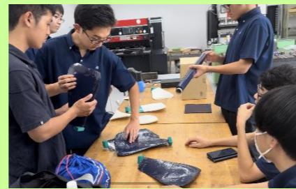
カーボンニュートラル大使の活動風景 (超小型風車の製作)