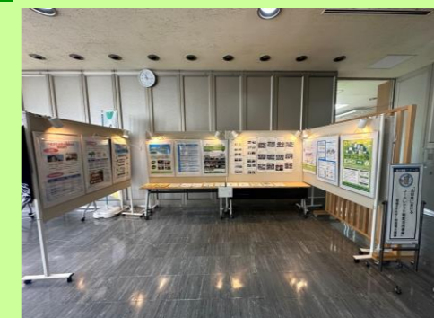
県庁ロビーでの展示の様子

県庁ロビーの展示コーナーにおいてJ-クレジットの取組みを紹介する他、県ホームページでもクレジットの購入企業や収益活用事業などを掲載しています。