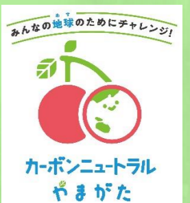
「カーボンニュートラルやまがた県民運動」 ロゴマーク