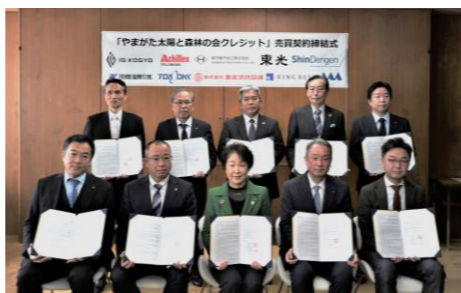
クレジット売買契約締結式の様子（令和5年度）