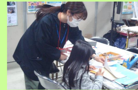
やまカボ・サポーター活動風景 (やまがた環境展2024)

県内の大学等の学生を対象に、環境に関する普及啓発活動を行う「学生環境ボランティア」を募集し、活動に必要な知識や能力を身に付けるための研修や施設見学等の実施により普及啓発の担い手として育成するとともに、県内各地で当該ボランティアによる普及啓発活動を実施しています。