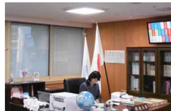
今年3月に環境大臣室にLED照明を導入