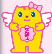
選挙のめいすいくんの妹 「メイちゃん」