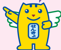
「選挙のめいすいくん」