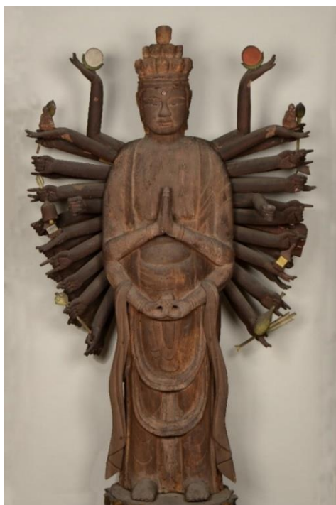
木造千手観音菩薩立像