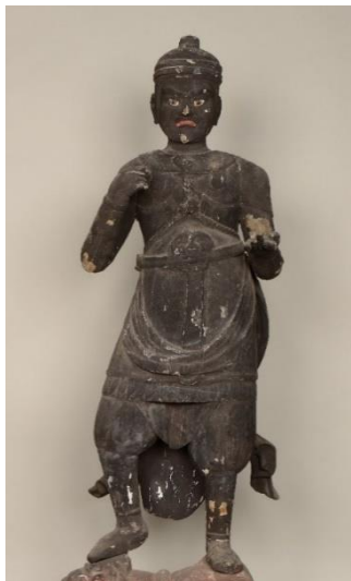
木造毘沙門天立像