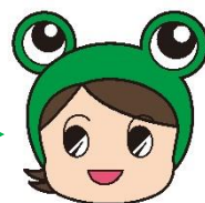
消費者教育推進大使 県消費生活センター キャラクター “ケロちゃん”

商品・サービスを選ぶ際に、「安心・安全・品質・価格」だけでなく、 これからは「エシカル消費」という選択肢も入れてケロ！