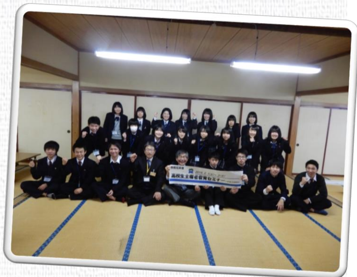
（令和元年度のセミナーの集合写真 左：内陸会場 右：庄内会場）

日 時 内陸会場 令和3年1月30日（土）山形県青年の家 庄内会場 令和3年1月31日（日）山形県立庄内農業高等学校