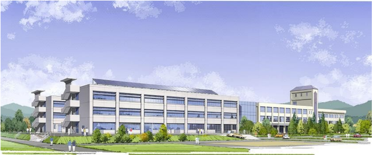
(「産振校舎」のイメージ)