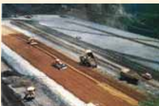
ダム建設当時の写真。