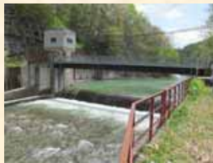
ダムの水は尾花沢市、大石田町の広い範囲に行き渡る。 (写真：鶴子頭首工)