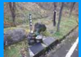
② プナ湧水 (尾花沢市寺町)