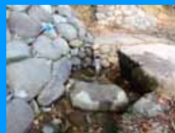
① 櫛の大立長寿の名水 (尾花沢市母袋)