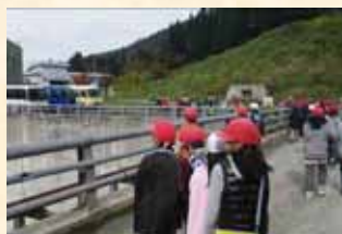
ダムや水の大切さを学ぶ地元の小学生。(尾花沢小学校)

村山北部三千四百ヘクタールの大地を潤す 新鶴子ダムは尾花沢市と大石田町の約三千四百ヘクタールの農地を潤している。農業用水だけでなく、水力発電、消流雪用水（冬場、水路の雪を消すための水）といったように地域の生活を支える重要な水源である。 農業用ダムとしては、国内最大級の規模である。平成の年号に変わり間もなく完成したことから「平成の湖」と呼ばれている。施設の操作点検は村山北部土地改良区が行っている。日々の管理に加えて、地元小学生にダム施設を案内するなど、ダムや農業用水の役割や大切さを教えている。ダム周辺には、温泉施設やスポーツ公園、スキー場などが並び、県内外の多くの人々に親しまれている。