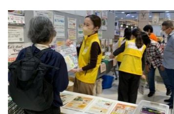
キャンペーンの様子